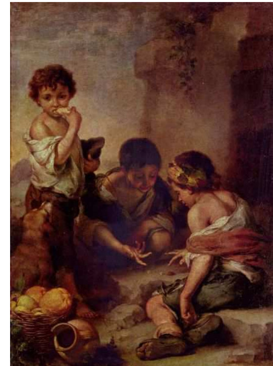
Imagen 1. Autor: Murillo . Dominio público