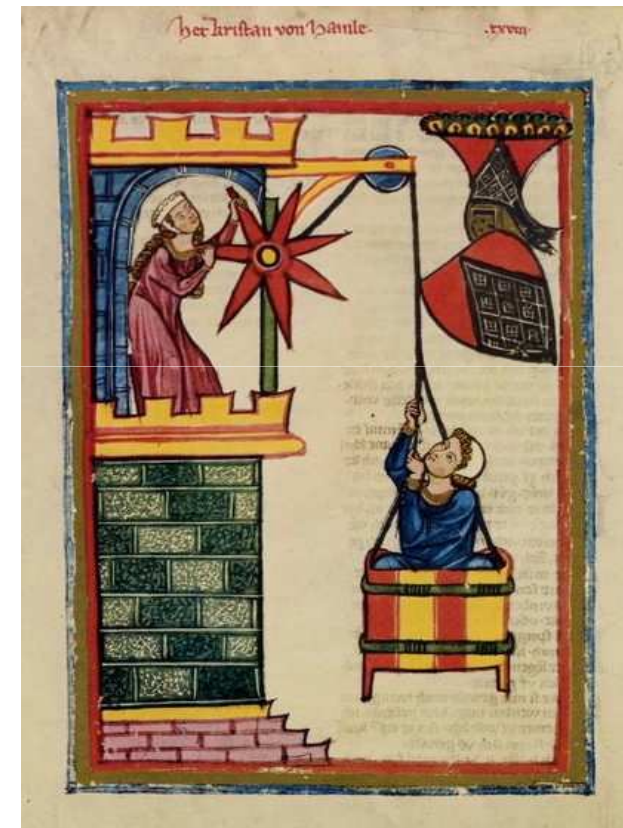
Imagen 1. Autor: Khistan of Hamle (Codex Manesse). Dominio público