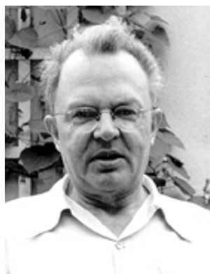
Carnap en Wikimedia Commons, bajo licencia Creative Commons.