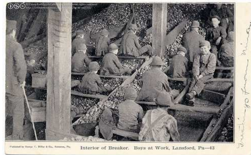
Imagen de postal en Flickr