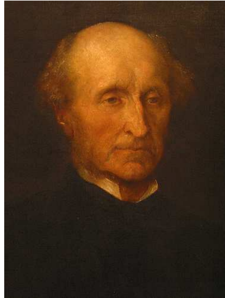
Imagen en Wikimedia Commons