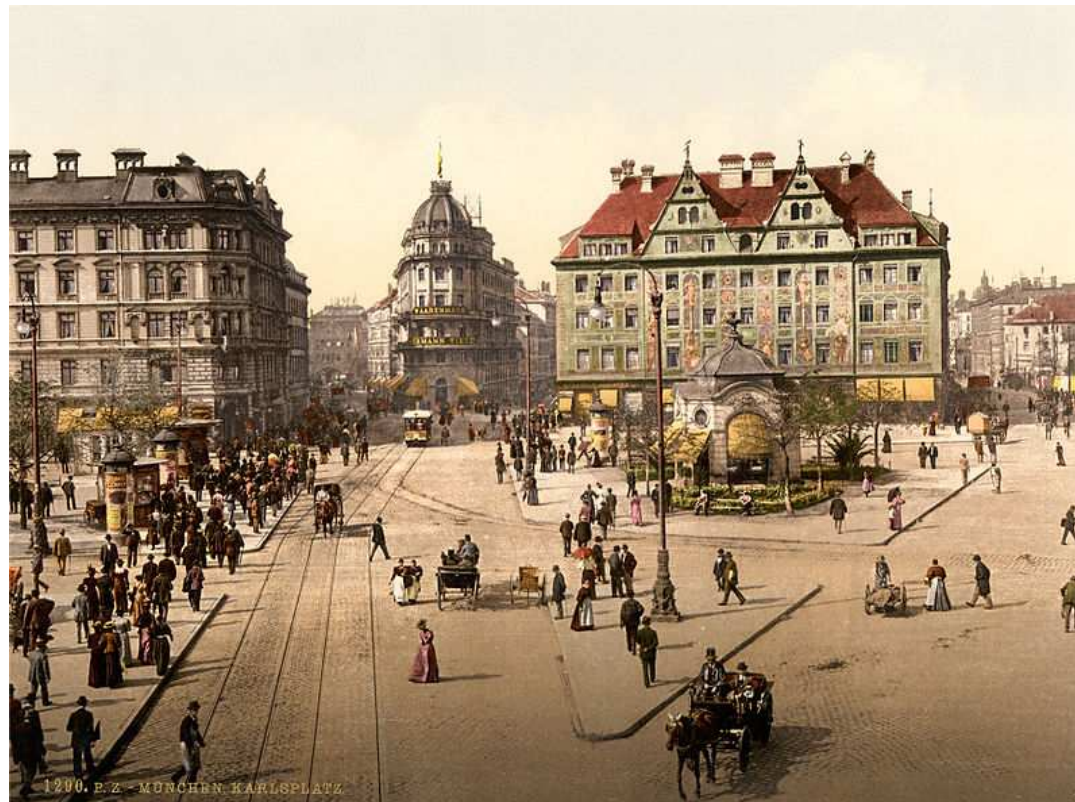
Imagen en Wikimedia Commons