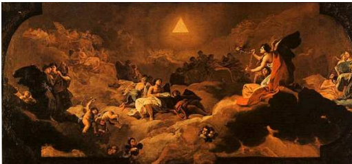
Dios en Wikimedia Commons, bajo licencia Creative Commons.