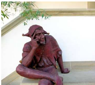
Geniecillo maligno en Wikimedia Commons, bajo licencia Creative Commons.

Descartes introduce la hipótesis del “geniecillo maligno” para decir que en mi naturaleza está el error (puedo equivocarme incluso cuando creo que estoy en lo cierto).