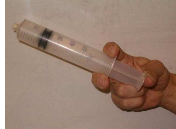
Imagen 2 de elaboración propia