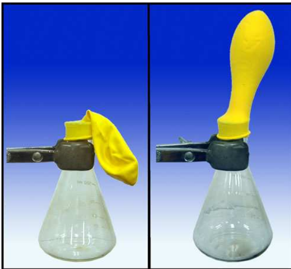
Imagen 3 de elaboración propia

Ley general de los gases PV/T=cte=f(\text{cantidad de gas})