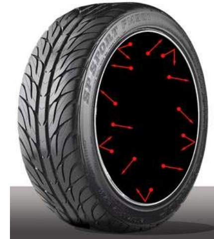
Imagen 4 de elaboración propia