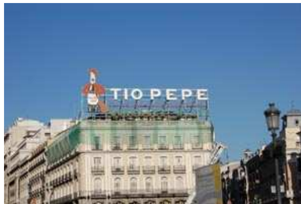
Imagen 1. Imagen de creación propia.