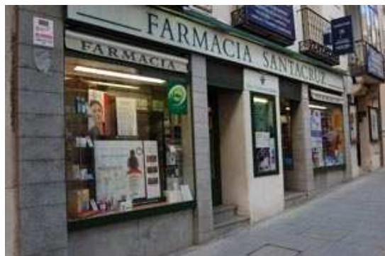
Imagen 2. Imagen de creación propia.